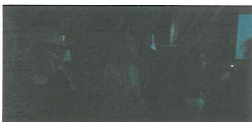
Público asistente presentación 7 de Julio, Tras bastidores