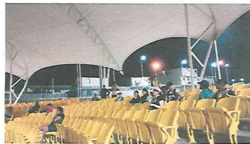
Público asistente 11/8/2023 Proyección cortometraje Clandestino

La segunda presentación se realizó el 11 de Agosto de 2023 en el teatro al aire libre del Parque de la Paz Carlos "El Pescadito Ruiz" z 21. Se proyectó el cortometraje Clandestino junto a los otros 3 cortometrajes seleccionados ante el público asistente.