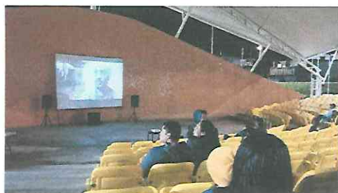
Público asistente 13/8/2023 Proyección cortometraje Clandestino

La cuarta presentación se realizó el 13 de Agosto de 2023 en el teatro al aire libre del Parque de la Paz Carlos "El Pescadito Ruiz" z 21. Se proyectó el cortometraje Clandestino junto a los otros 3 cortometrajes seleccionados ante el público asistente.