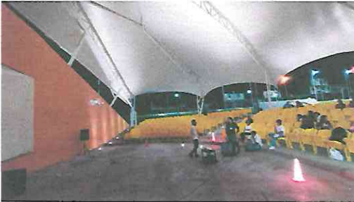
Público asistente 11/8/2023