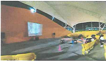
Público asistente 12/8/2023 Proyección cortometraje Clandestino

La tercer presentación se realizó el 12 de Agosto de 2023 en el teatro al aire libre del Parque de la Paz Carlos "El Pescadito Ruiz" z 21. Se proyectó el cortometraje Clandestino junto a los otros 3 cortometrajes seleccionados ante el público asistente.