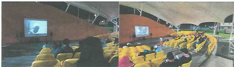
Público asistente 13/8/2023 Proyección cortometraje Clandestino