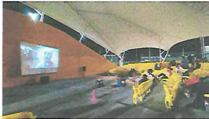
Público asistente 12/8/2023 Proyección cortometraje Clandestino